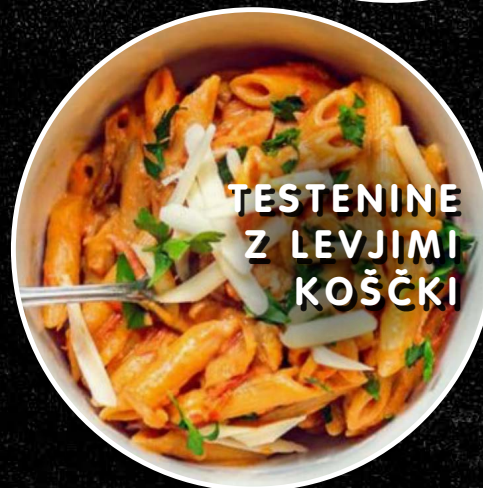
TESTENINE Z LEVJIMI KOŠČKI