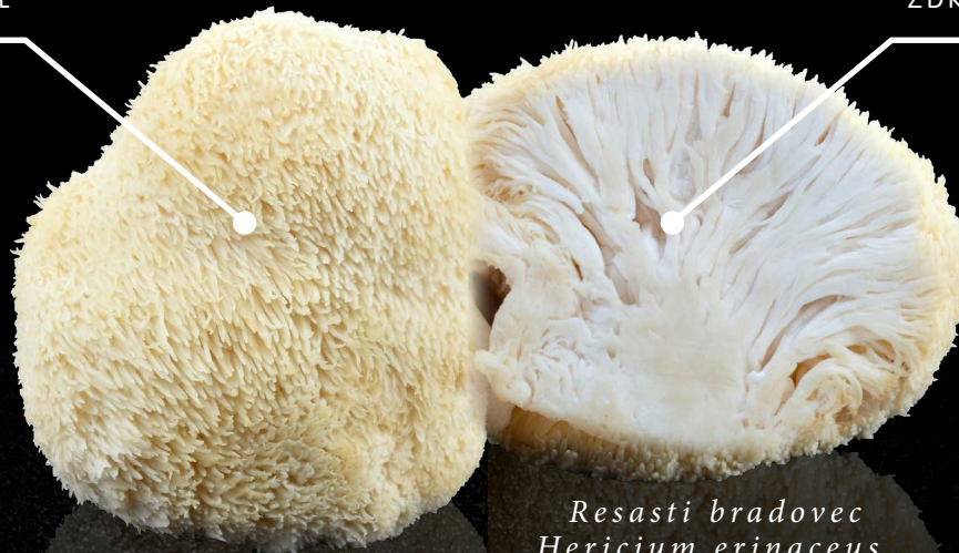
Resasti bradovec Hericium erinaceus

Blagodejni učinki na živčevje, proti demenci in multipli sklerozi ter želodčnim težavam. Hericium erinaceus ali slovensko Levja griva je okusna jedilna in zdravilna goba značilnega izgleda.