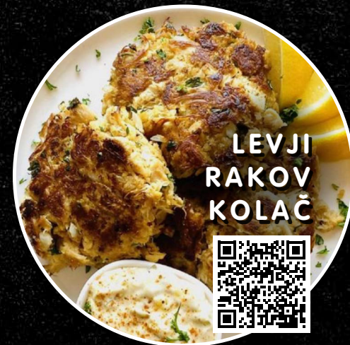
LEVJI RAKOV KOLAČ

1kg sveže Levje grive je volumen 10-15 litrov za cca 4-8 obrokov (odvisno od jedi) omogoča veliko dodano vrednost tudi za gostinca.