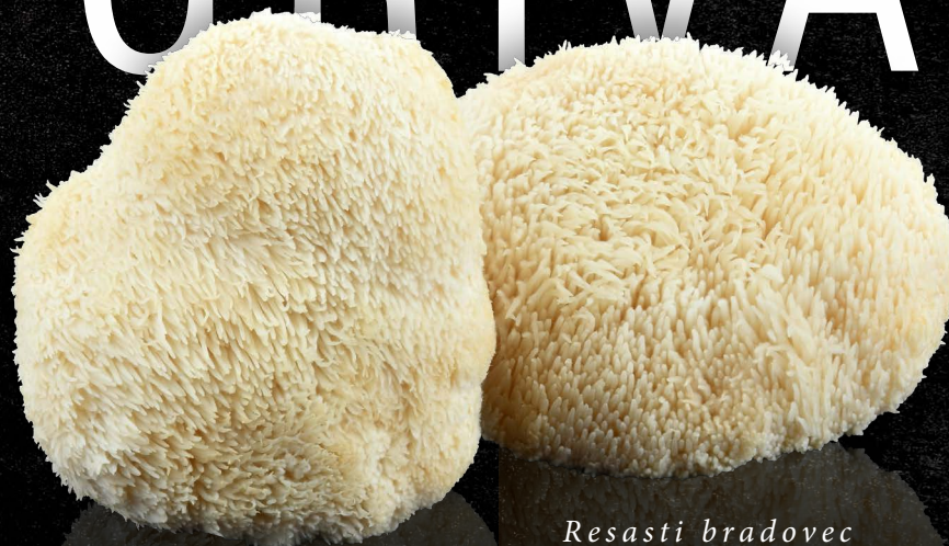
Resasti bradovec Heridium erinaceus