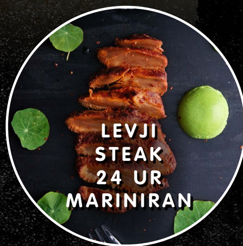
LEVJI STEAK 24 UR MARINIRAN

Hericium erinaceus je v kliničnih raziskavah kazal tudi protibakterijske učinke in pri številnih bolnikih odpravil okužbo z bakterijo MRSA (proti meticilinu odporni Staphylococcus aureus ) ter pri 89,5% bolnikov, okuženih s Helicobacter pylori , zavr bakterijo ter na ta način zdravlil gastritis in razjede na želodcu (Powell, 2010; Donatini, 2014).